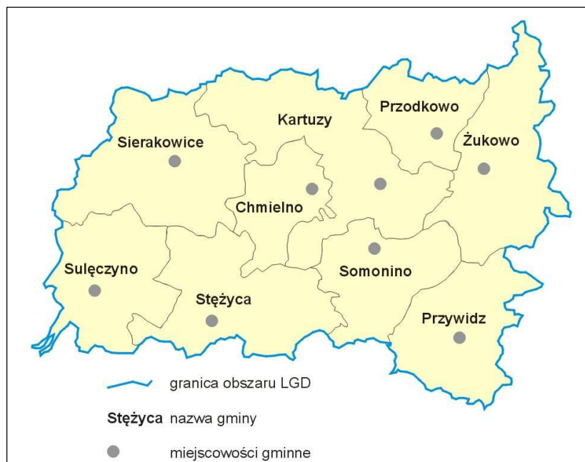
Rys. Obszar LGD.

Jak wynika z przedstawionego opisu oraz załączonej poniżej mapy teren LGD jest w pełni spójnym obszarem pod względem przestrzennym.