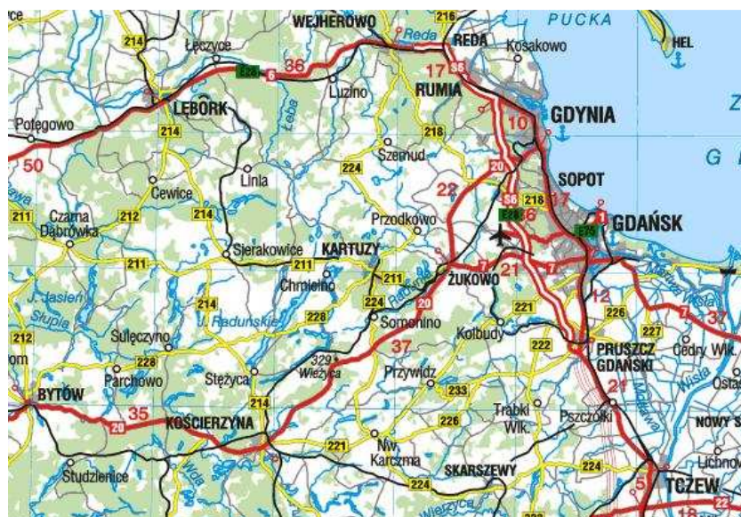
Rys. Położenie obszaru LGD w regionie (obszar LGD wraz z obszarami sąsiednimi).

Pod względem fizycznogeograficznym obszar Lokalnej Grupy Działania położony jest w całości na terenie Pojezierza Kaszubskiego należącego do makroregionu Pojezierza Wschodniopomorskiego i podprovincji geograficznej Pobrzeży Południowobałtyckich. Pojezierze Kaszubskie jest tym samym największym regionem fizycznogeograficznym województwa pomorskiego. Obszar ten sąsiaduje z: